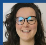
POAS Apolline 23 ans Hauts de France - Crazy & Tri